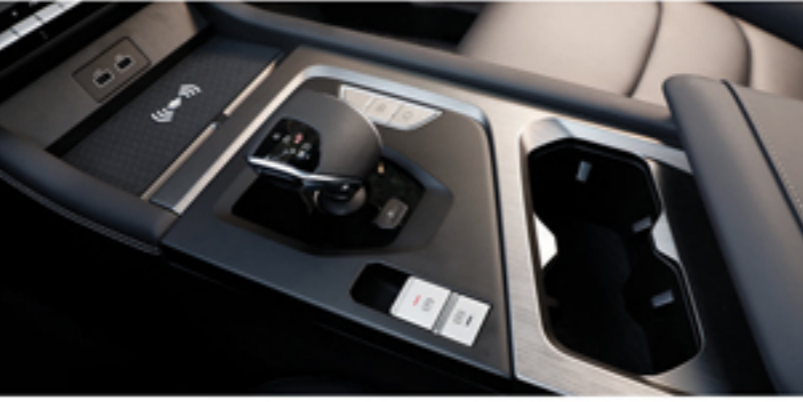
سیستم تعویض دنده الکترونیکی