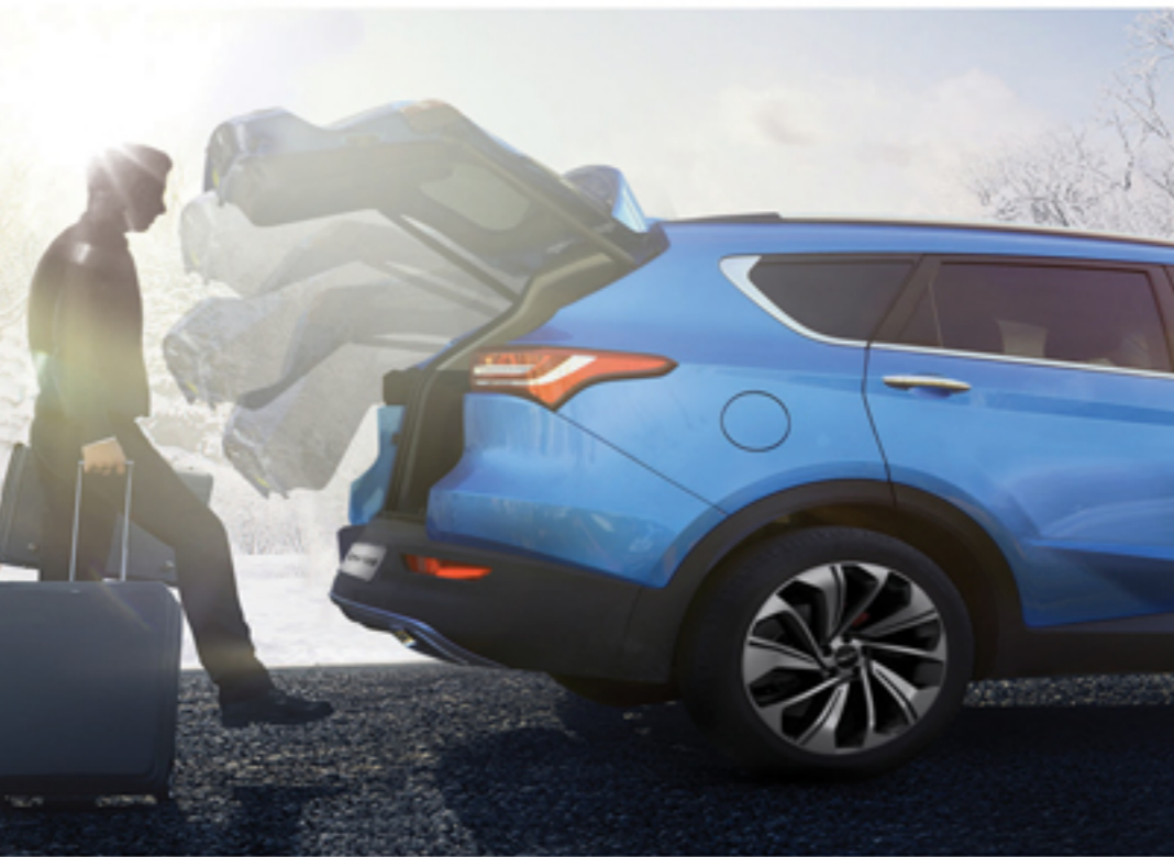
سیستم هوشمند باز شدن اتوماتیک درب صندوق (توسط پا)