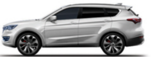
سفید دماوندی Damavand White