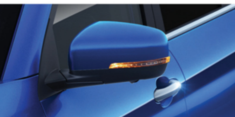
آینه های جانبی جمع شونده اتوماتیک به همراه گرمکن چراغ راهنما و خوش آمدگویی