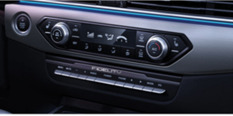
سیستم تهیه مطبوع یا کنترل الکترونیکی به همراه درجه برای سرنشینان عقب