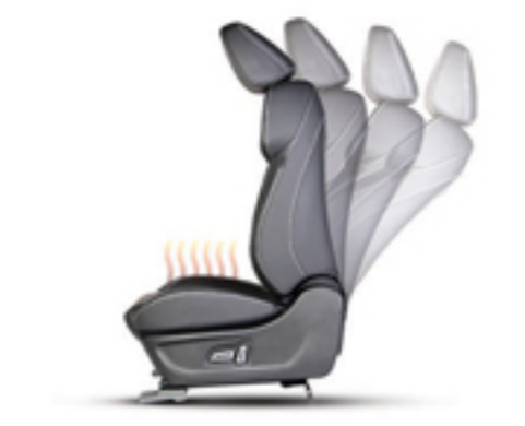
صندلی برقی راننده و سرنشین به همراه گرمکن