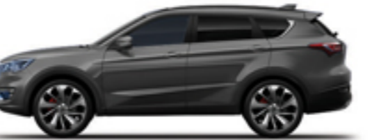
خاکستری گرافیتی Graphite Grey