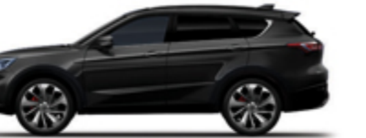
مشکی یاقوتی Sapphire Black