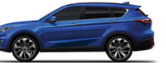
آبی اطلسی Atlantic Blue