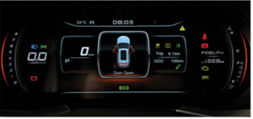
جلوآمپر ۱۲/۳ اینچی دیجیتال (TFT)