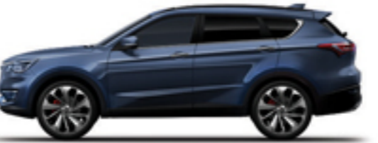
خاکستری کهکشانی Galaxy Grey