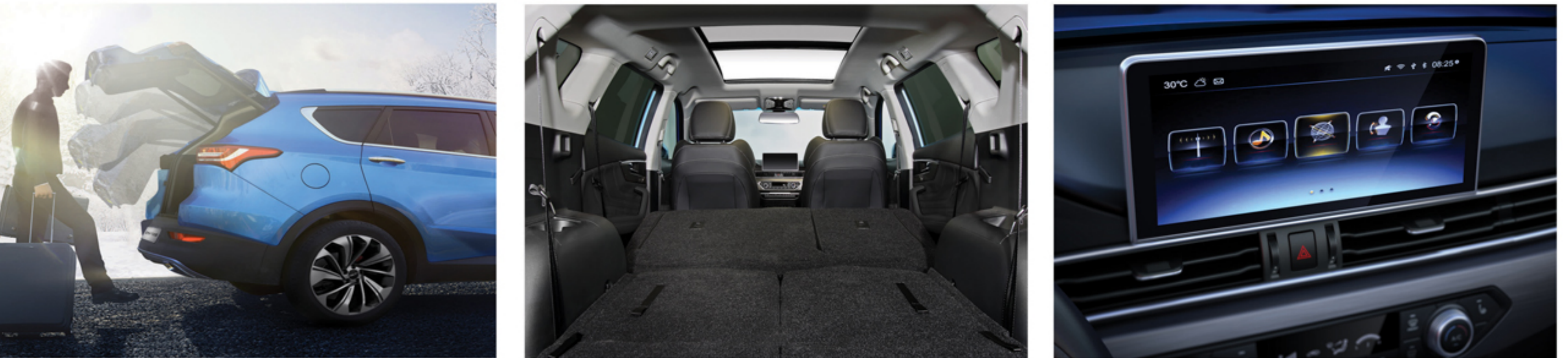
صفحه نمایشگر لمسی ۱۰/۲۵ اینچی به همراه Bluetooth