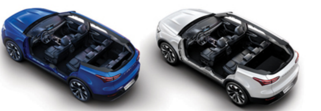
در دو مدل ۷ و ۵ نفره