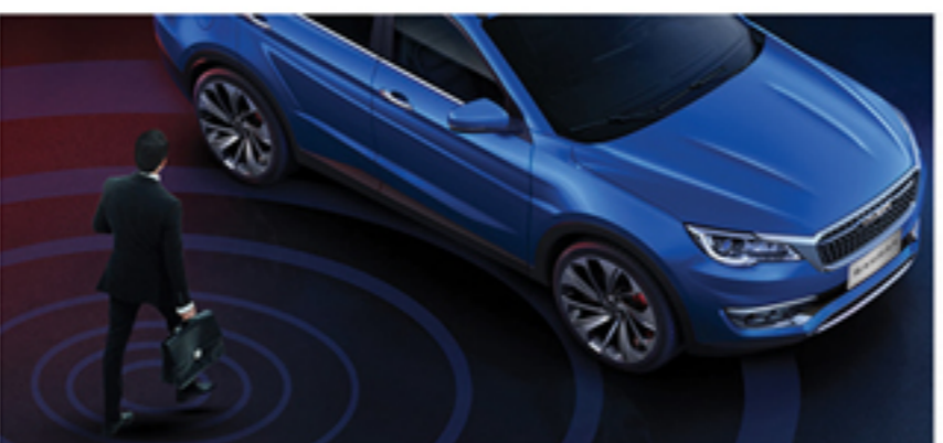
سیستم هوشمند ورود بدون کلید (Keyless)