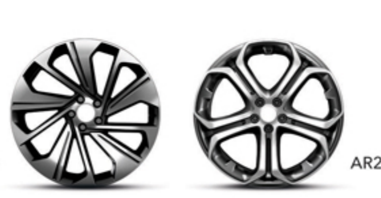
مدل: AR20-12 رینگ آلومینیومی ۲۰ اینچی مدل: AR20-11