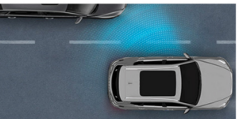
سیستم رادار تشخیص نقاط کور (BSD)