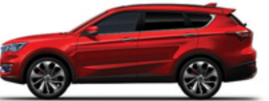
قرمز روناسی Ronass Red